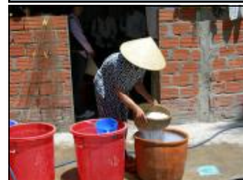
Kinh phí RUDEP hỗ trợ các quỹ cho phép thành viên của quỹ xác định những hoạt động mà sẽ thúc đẩy đa dạng hóa thu nhập. Quỹ này ở xã Phố Châu đã xác định hoạt động làm bún là hoạt động thử nghiệm. Hợp đồng được ký kết với một chị phụ nữ ở xã bên để hỗ trợ kỹ thuật về cách làm bún.

Quảng Ngãi. Sự hỗ trợ dành cho các tổ chức tài chính và tín dụng hiện có (như Ngân hàng CSXH) được xem là cách tiếp cận bền vững hơn. Vì thế, định hướng mới này đồng nghĩa với hoãn mở rộng các quỹ trong năm 2007. Kinh phí RUDEP đã dành cho thành lập các quỹ mới sẽ được phân bổ cho các hoạt động khác. Hỗ trợ cho 169 quỹ hiện thời sẽ tiếp tục trong năm 2007 và hoạt động của các quỹ vẫn sẽ được theo dõi. Chiến lược rút khỏi đang trong quá trình xây dựng.