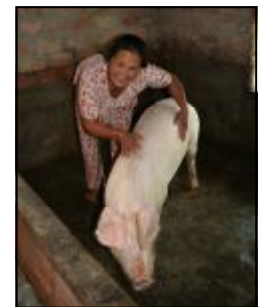
CT 135-II sẽ có hợp phần hỗ trợ sản xuất nông nghiệp cho mỗi xã. Theo đề xuất, các phương pháp khuyến nông có sự tham gia và phù hợp với đối tượng hộ nghèo sẽ được đưa vào Hướng dẫn hợp phần Sản xuất nông nghiệp.