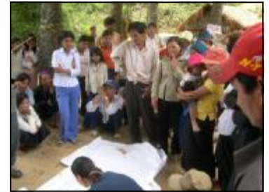
Lập KH phát triển xã lồng ghép (CDP lồng ghép) hướng đến gắn kết các ưu tiên của người dân với các chương trình, dự án và nguồn kinh phí sẵn có. Theo dự kiến, CDP lồng ghép sẽ được Chương trình 135-II áp dụng làm quy trình lập KH để xác định các hoạt động sẽ được Chương trình tài trợ ở mỗi xã.

Muốn biết thêm thông tin về sự hỗ trợ của RUDEP đối với Chương trình 135-II và xây dựng lộ trình Chương trình 135-II của tỉnh, bạn có thể liên hệ qua địa chỉ email sau của RUDEP ( adminqrndp@dng.vnn.vn ).