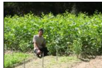
Tiếp cận cây giống lâm nghiệp cao sản với chu kỳ ngắn là điều quan trọng để hỗ trợ các hộ dân tạo thu nhập nhờ vào lâm nghiệp. RUDEP hiện đang hỗ trợ triển khai các vườn ươm cây lâm nghiệp do hộ gia đình vận hành sản xuất keo giống cao sản tại nhiều xã.

ĐGTĐMTXH cho thấy cần kiểm tra đối chiếu phương án giao đất và sự tham gia của đại diện Hội/Đoàn thể, Thôn nhằm ngăn chặn sự thiếu công bằng trong giao đất. Nguồn tín dụng đầy đủ, tiếp cận các giống cây lâm nghiệp và dịch vụ khuyến lâm là cần có để hỗ trợ các hộ dân đầu tư vào lâm nghiệp. Tăng cường năng lực cán bộ địa chính xã, cán bộ kiểm lâm là cần thiết để hỗ trợ bảo vệ môi trường, ngăn chặn các hộ dân bán giấy chứng nhận sử dụng đất, và bảo vệ quyền của hộ được giao đất lâm nghiệp. Các khóa tập huấn về GĐLN CSTG và các bước thực hiện kết hợp cả nội dung về rủi ro và chiến lược quản lý đã được xác định trong ĐGTĐMTXH.